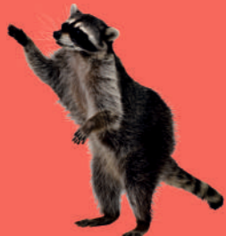
ЕНОТЫ И ЕНОВИДНЫЕ СОБАКИ